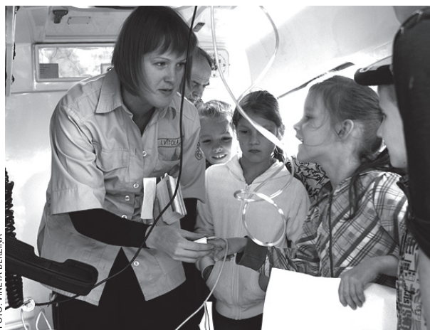
Iepazīstot ātrās palīdzības mašīnu