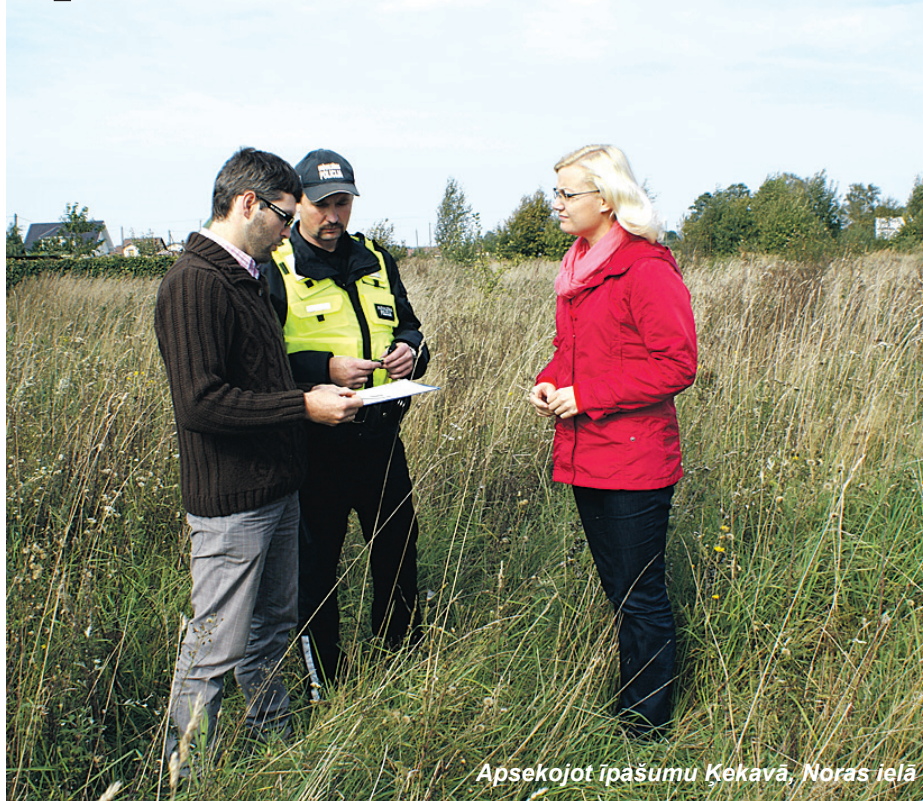
Apsekojot īpašumu Ķekavā, Noras ielā

Lai laikus novērstu kūlas dedzināšanu pavasarī, šobrīd Reģionālā pašvaldības policija kopā ar vides speciālistiem apseko nesakoptos īpašumus Ķekavas novadā.