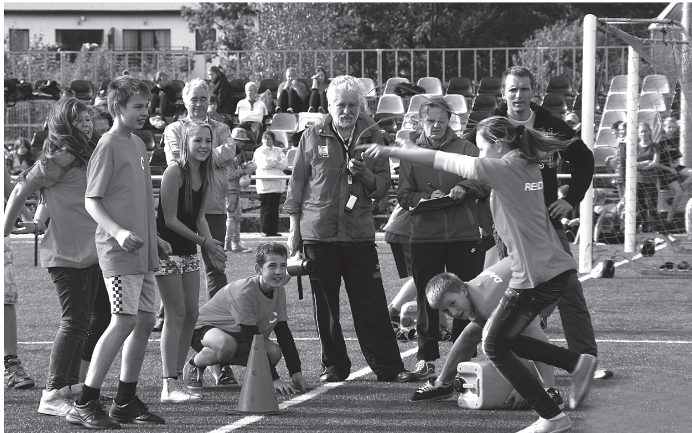
Olimpiskās dienas sacensības

“Olimpiskā diena domāta ikvienam, lai vai kāda būtu viņa sportiskā varēšana. Šī diena ir kaut kas vairāk par vienkāršu sportošanu, skriešanu vai vingrināšanos. Tā ir iespēja aizdomāties par olimpiskajām spēlēm tajā nozīmē, ka mums vienmēr jācenšas parādīt pašu labāko, ko spējam, vienlaikus apzinoties, ka svarīgākais nav uzvarēšana vai zaudēšana, bet sapratne, kā vislabāk spēlēt šo spēli. Filozofija, kas var noderēt ikdienas dzīvē.”