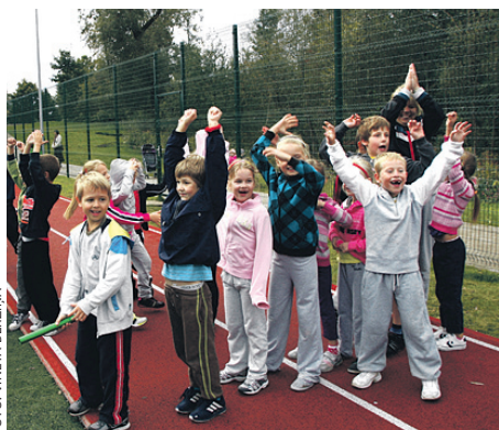
Drošības diena 2012 ⇨ 7. lpp.